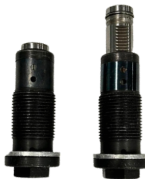
Foto A: differenza tra un tenditore pre-tensionato (sinistra) e uno sbloccato (destra)

Durante la procedura di montaggio del kit tendicatena seguire scrupolosamente tutte le istruzioni fornite dalla casa costruttrice, ponendo particolare attenzione al montaggio del tenditore idraulico superiore, che dev'essere installato senza essere sbloccato (foto A).